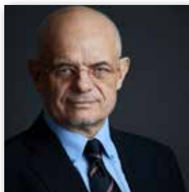
António Fidalgo Reitor da UBI

A UBI é essencialmente uma instituição de criação de ciência, de ensino e formação superior, a quem cabe transmitir às novas gerações o saber adquirido em todos os tempos e em todos os lugares. É toda essa dimensão de passado, de presente e de futuro que pretendemos valorizar com a ligação aos Alumni.